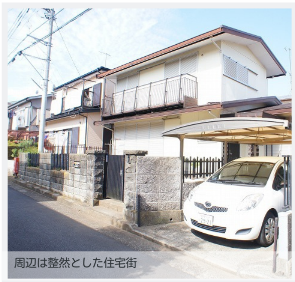
周辺は整然とした住宅街