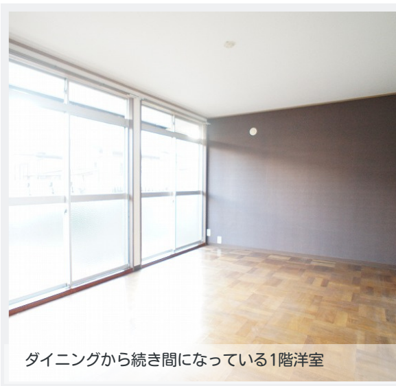
ダイニングから続き間になっている1階洋室